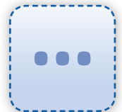
und vieles mehr!