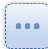
und vieles mehr!