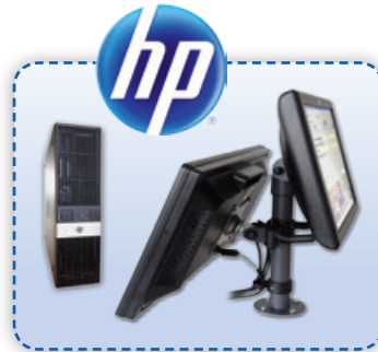
SlimSize - verteiltes Kassensystem

Bis zu 5 Jahre Vor-Ort-Garantie auf ausgewählte Hardwaresysteme!