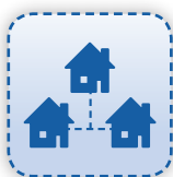
Filial- oder Franchise

Module erweitern den ETRON Funktionsumfang und geben Ihnen noch mehr Werkzeuge in die Hand – ob es sich um Kundenbindungsmaßnahmen , professionelles E-Mail Marketing oder Ihren Webshop handelt. Sie können von Anfang an auf diese Erweiterungen zählen oder sie mit wachsenden Unternehmensanforderungen zu einem späteren Zeitpunkt hinzukaufen. Folgen Sie dem Link (im QR-Code) für eine Übersicht aller Module.